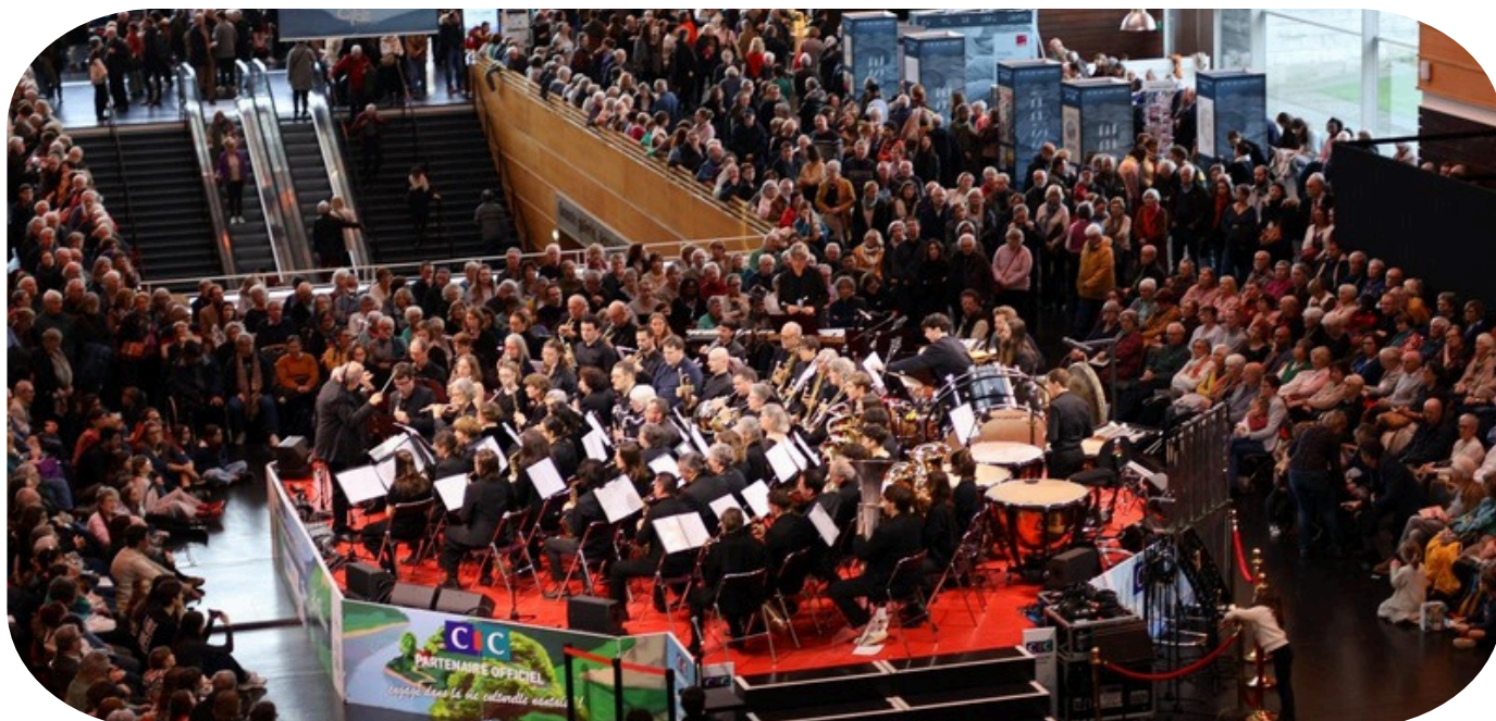
Les folles journées 2026