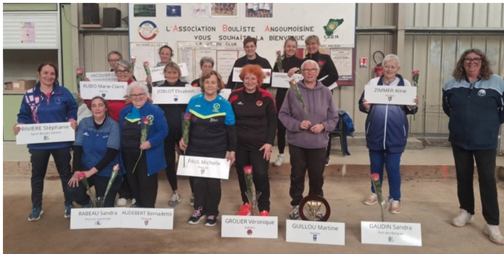
Groupe Open Angoulême