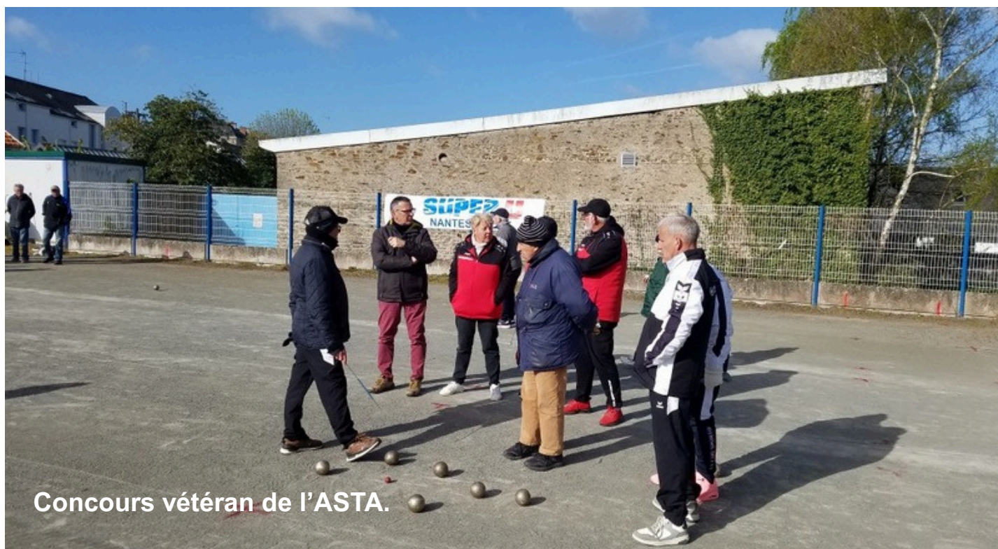
Concours vétéran de l'ASTA.