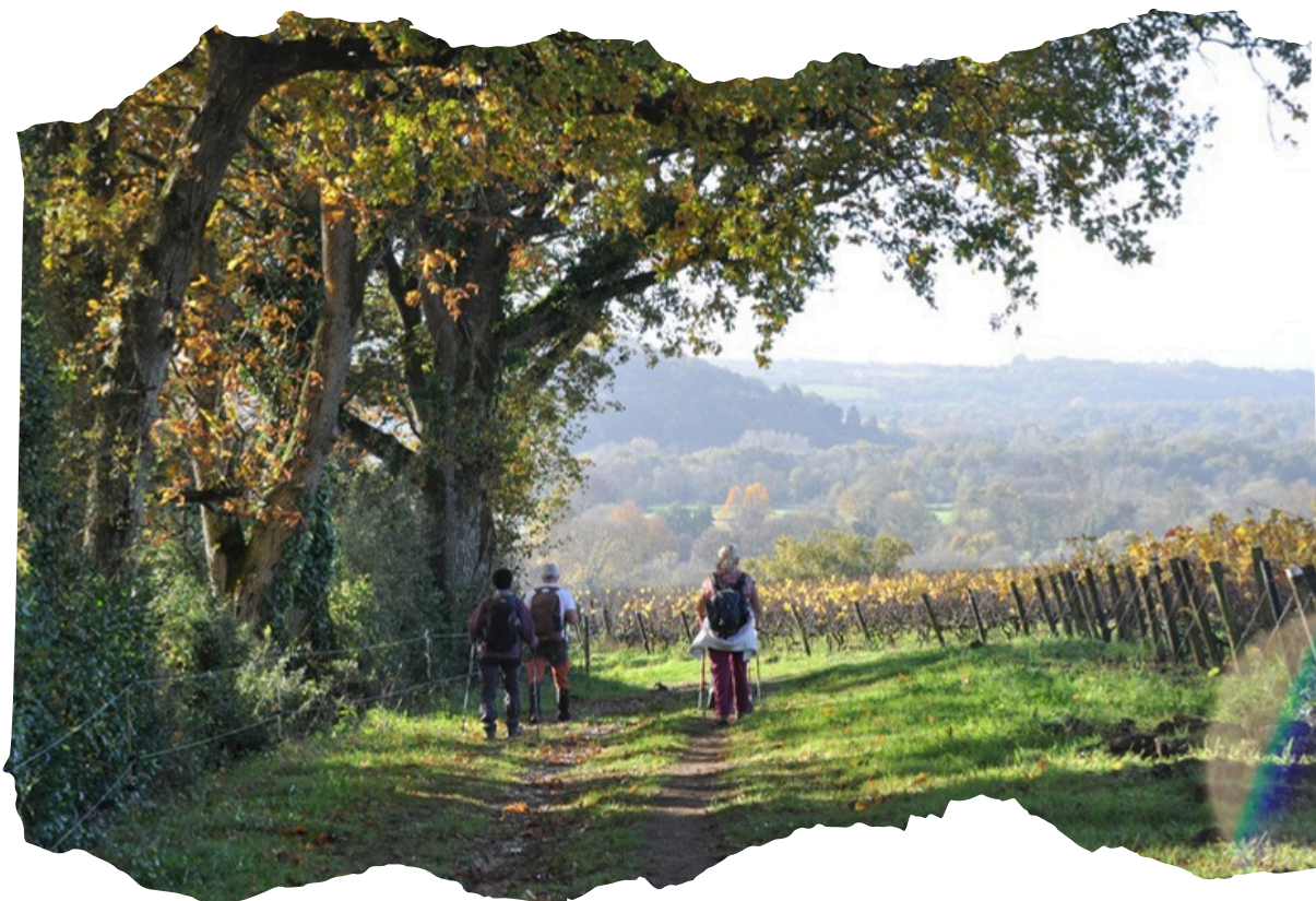
Brevet des grimpeurs à Oudon

Et bien sûr, l'ASTAPAT continue à organiser des séjours ou week-ends de randonnée. Comme vous pouvez le constater, avec l'ASTAPAT, randonnée - culture - découverte se complètent tout au long de l'année sportive.