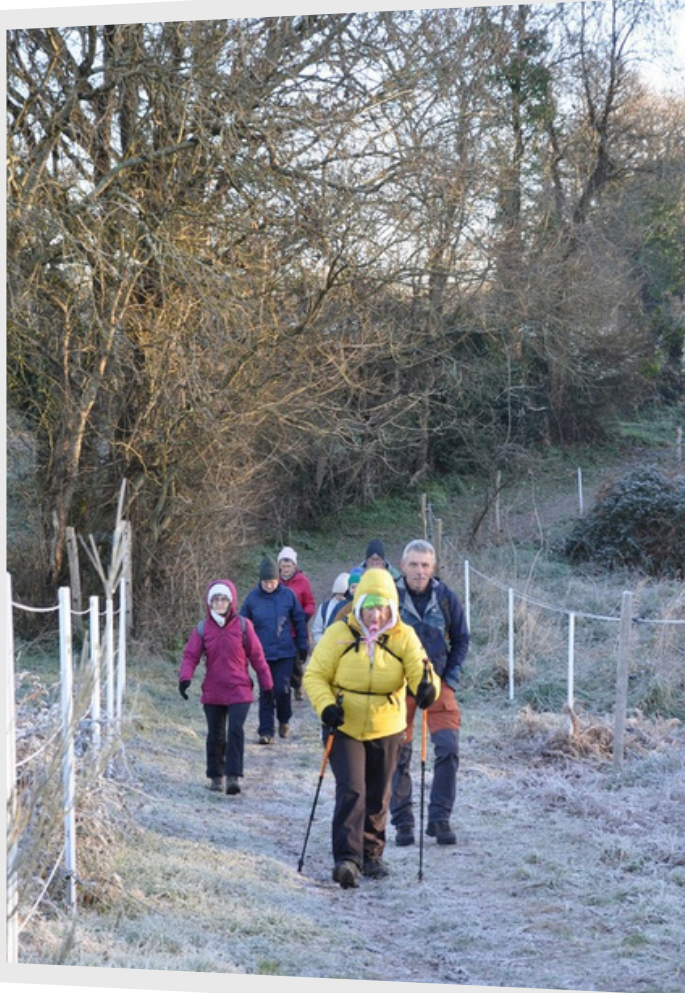
Saint Étienne de Montluc