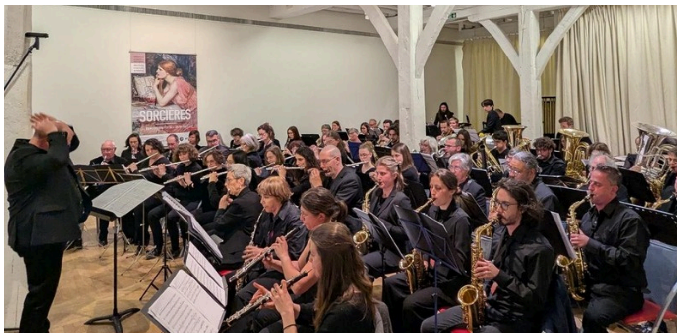
Concert au château des Ducs de Bretagne